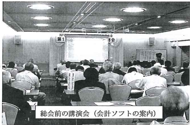
総会前の講演会（会計ソフトの案内）

今大会は、役員改選の年となり、次のとおり、平成24年度の役員を選出し、役職を決定いたしましたので、お知らせいたします。今後も引き続きよろしくお願いいたします。