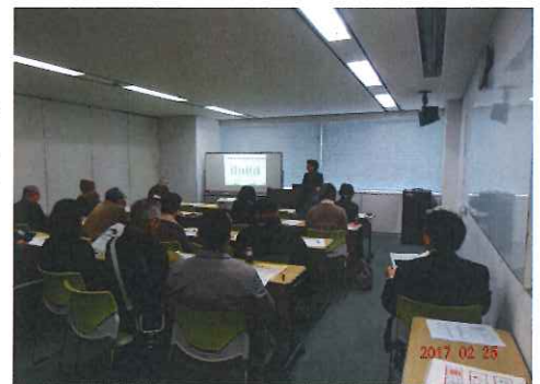
全 体 風 景